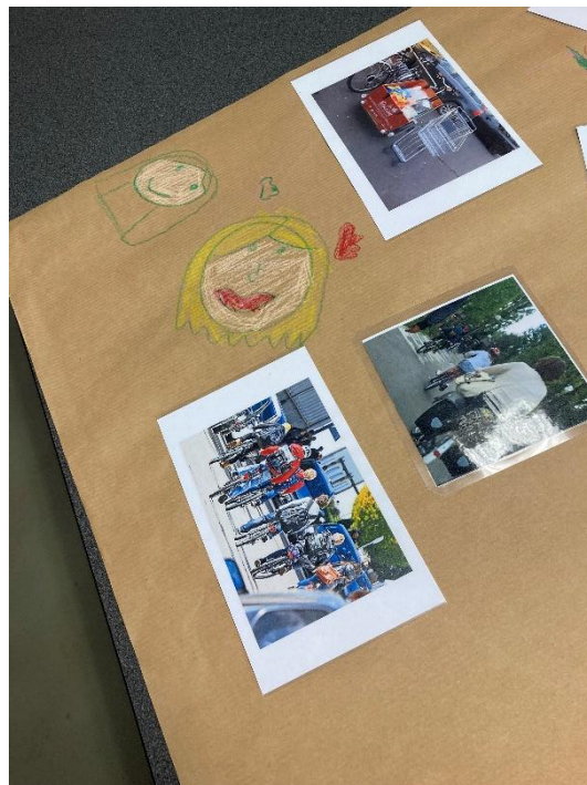
Verhalten Lebensmittel und Fortbewegung

Schließlich sind wir in verschiedenen Bullis nach Hause gebracht worden. Es war ein toller Ausflug.